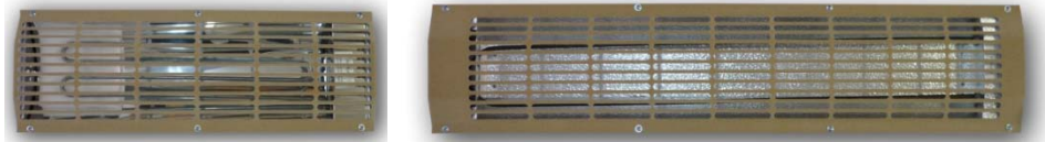
IRS 4 RHK-400W